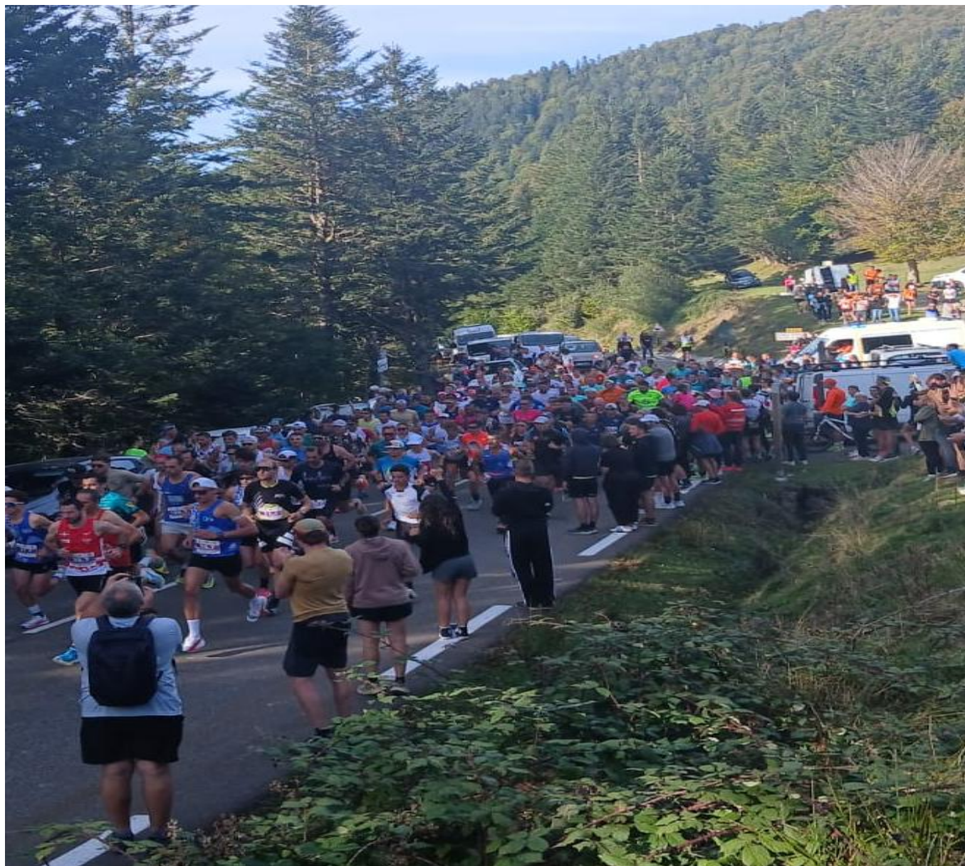
Samedi 27 Septembre, le Tour du Béarn Pédestre arrive à la Pierre St Martin.